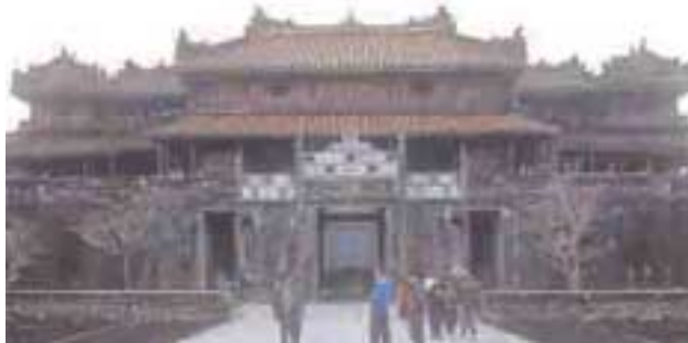
Edificio en la ciudad imperial de Hue -Vietnam-